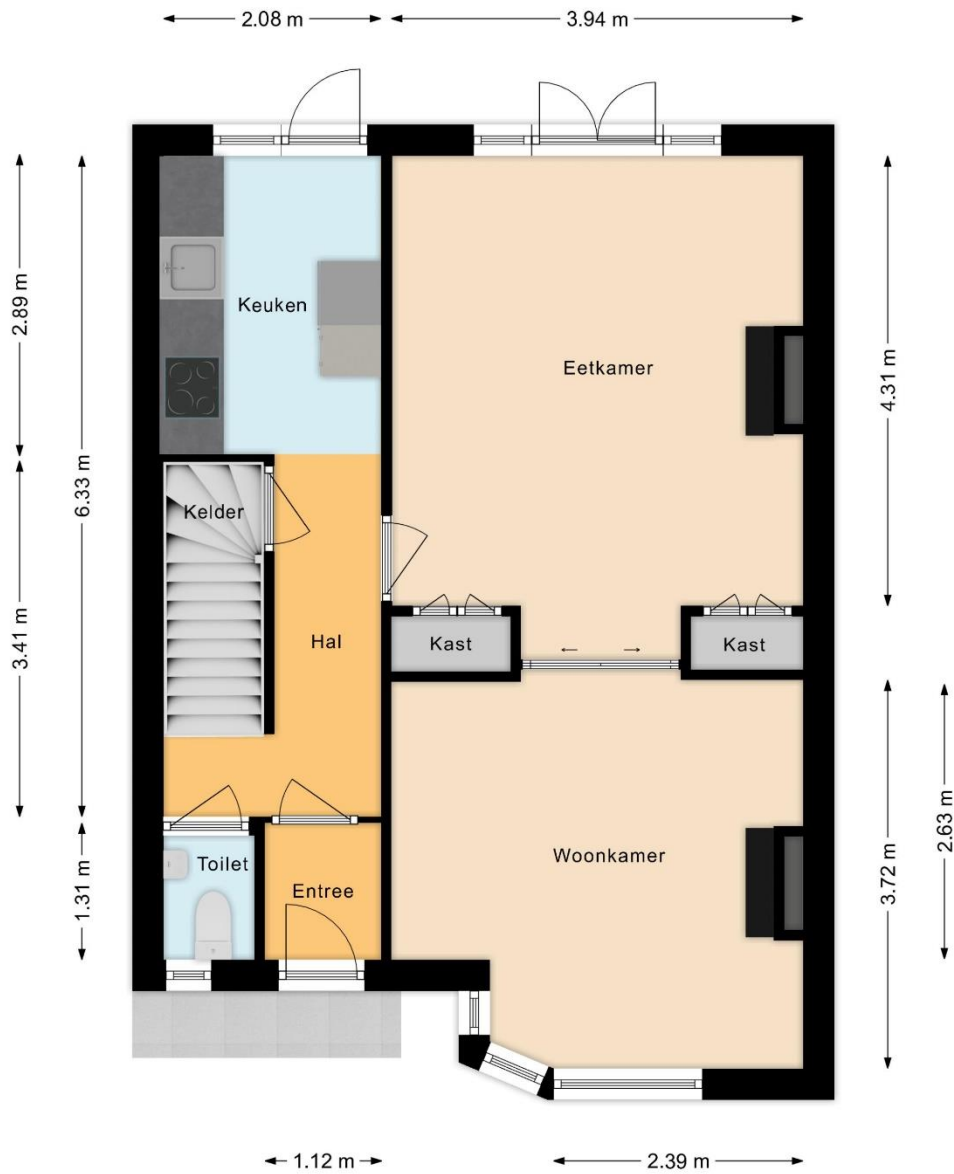
Tweede woonlaag, Kalfjeslaan 9 te Amstelveen