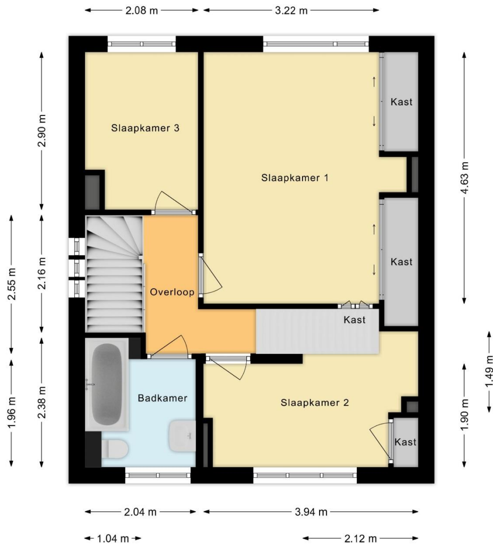
Derde woonlaag, Kalfjeslaan 9 te Amstelveen